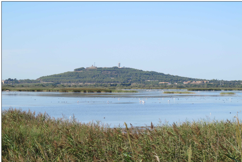
Le Mont Saint Loup, notre Grand Pioch

du Lundi 17 décembre au Vendredi 4 janvier 2019